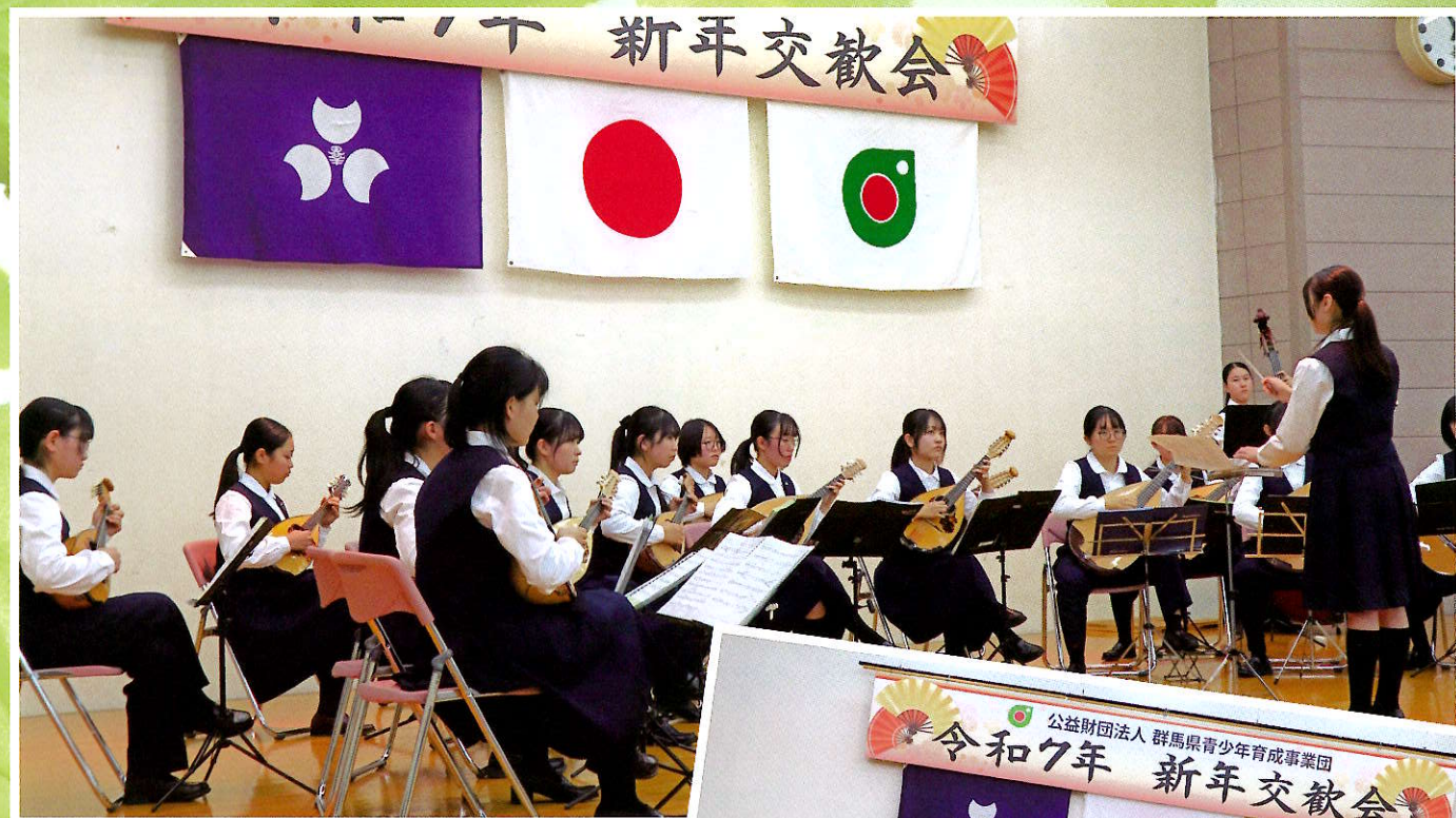
新年交歓会のアトラクション 群馬県立前橋女子高等学校ギターマンドリン部の演奏