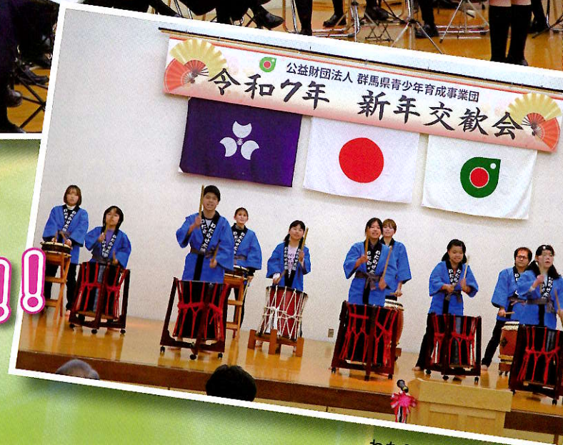
わたらせ義護園 和太鼓演奏