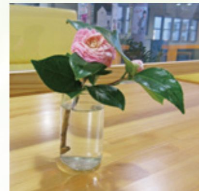
ロビーに飾った花

正面玄関のプランターはガールスカウト団員の方、ロビーは職員が育てた花を飾っています。敷地内の花壇で四季折々の花を育てています。