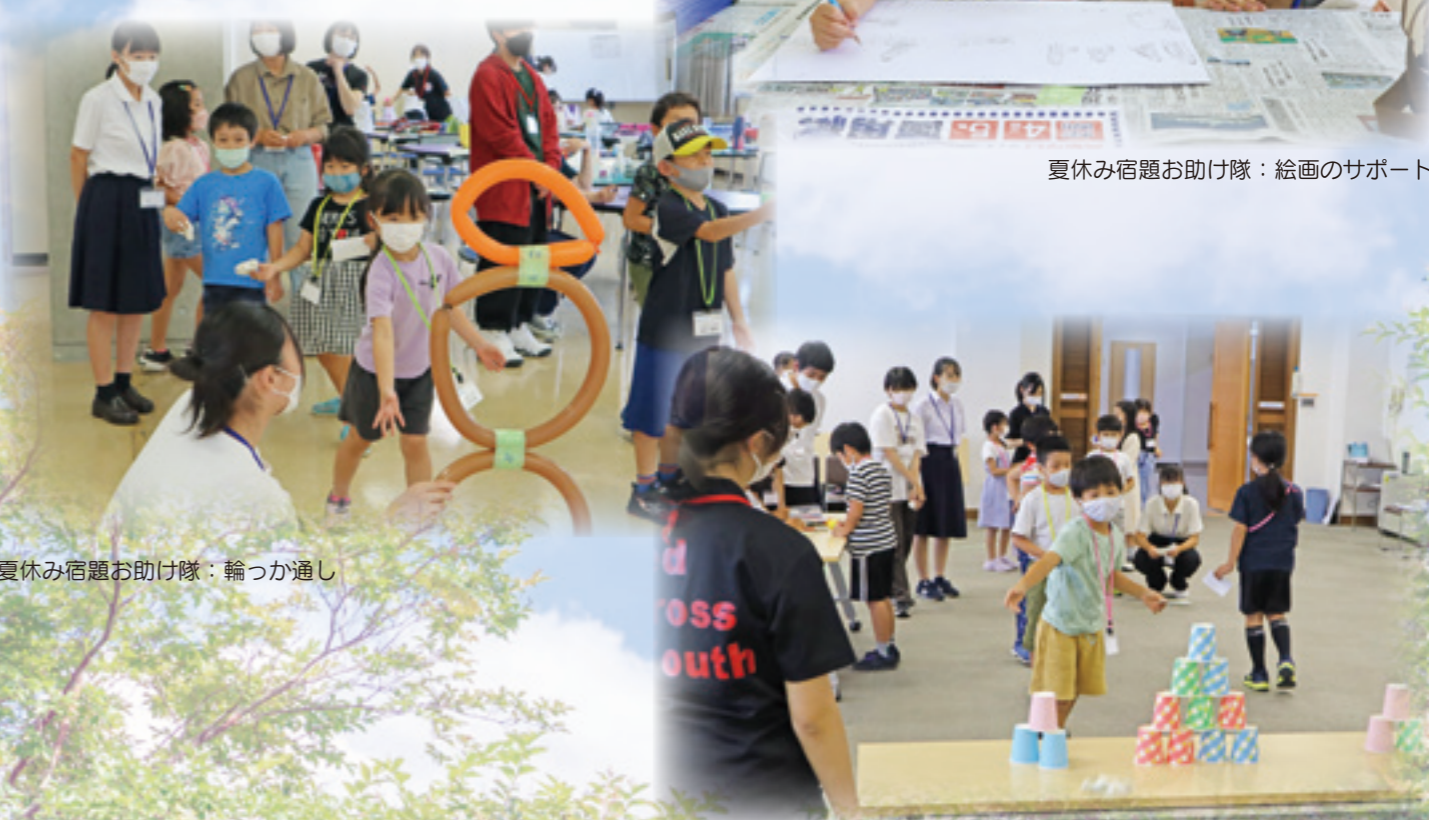
夏休み宿題お助け隊：輪っか通し