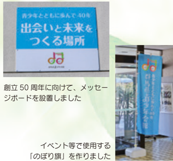
創立 50 周年に向けて、メッセージボードを設置しました

これからも、役職員一同、気持ちも新たに青少年の健全育成に取り組んでまいります。そして、青少年会館は引き続き青少年団体の活動拠点として、また、青少年の出会いと交流の場所として、着実な歩みが続けてまいります。皆様のより一層のご支援ご協力をよろしくお願い申し上げます。