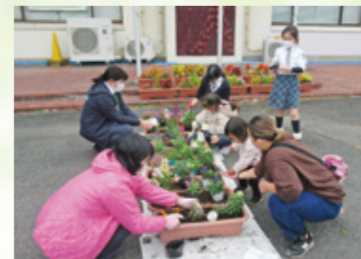
ガールスカウト団員によるプランター