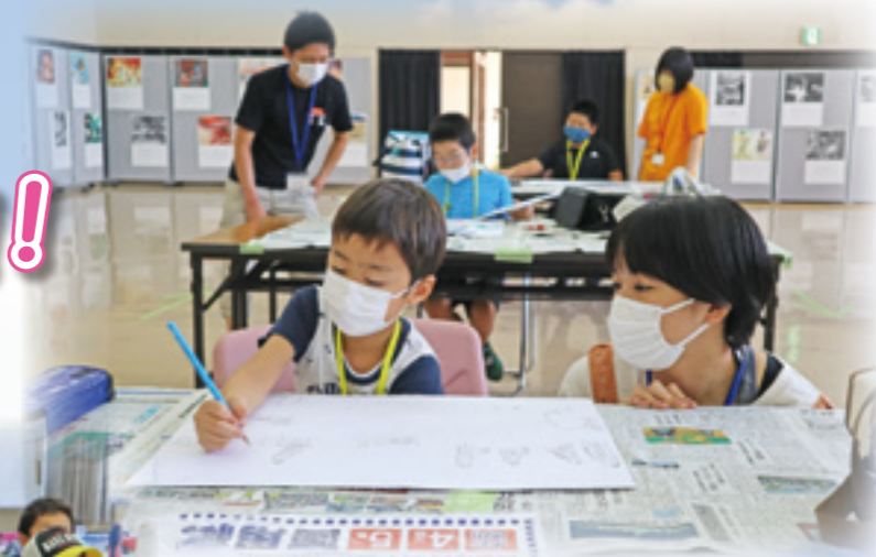
夏休み宿題お助け隊：絵画のサポート