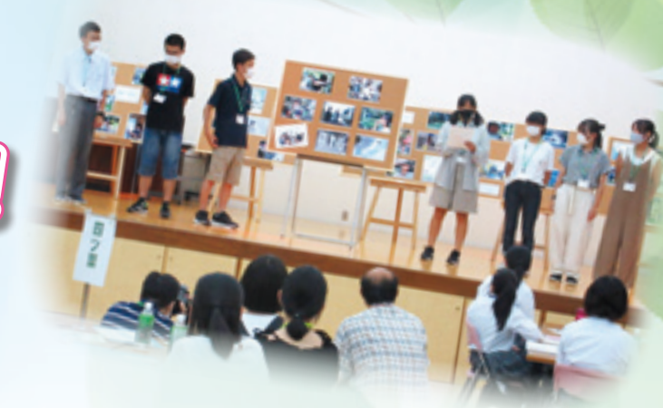
高校生写真講座：「組写真」の作品発表 9月