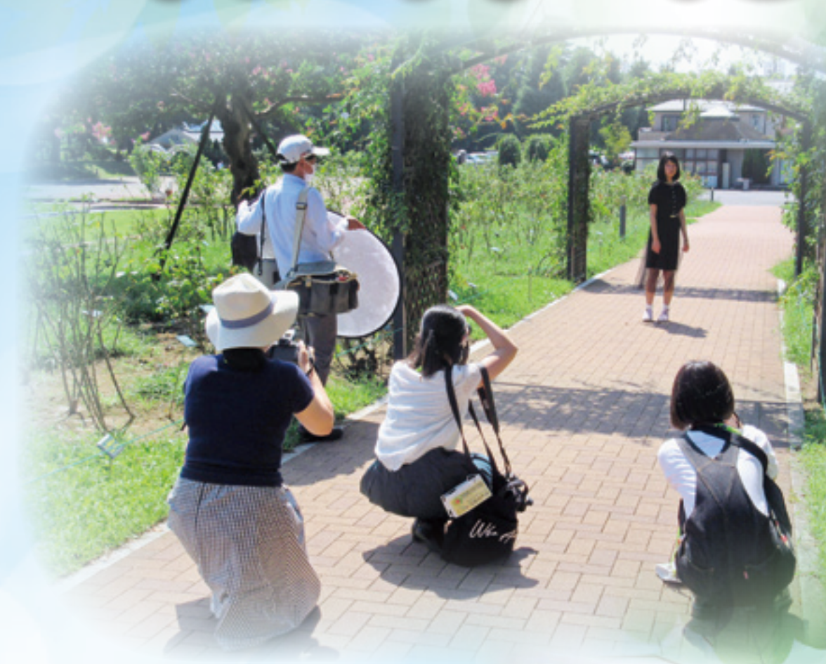
高校生写真講座：敷島公園での撮影実習風景 9月