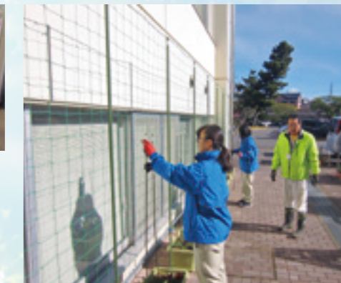
勢多農林高校生：植栽の補助