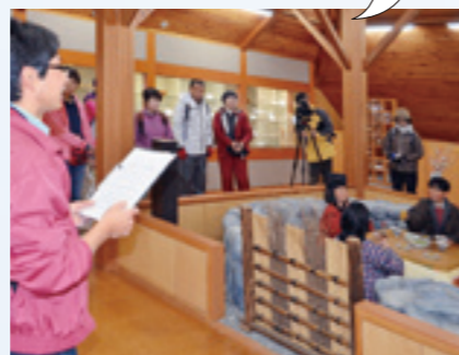
おひながゆの資料館

様々な年代が参加でき、世代交流できるツアーで、村民が参加しても楽しめるものであると思った。