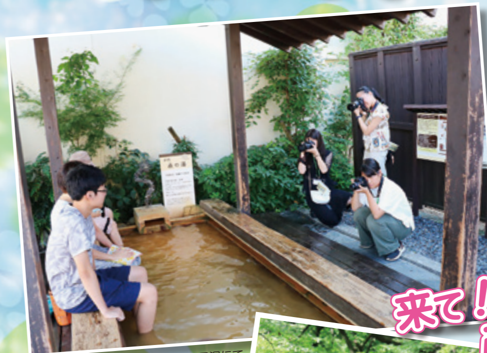
高校生写真講座：伊香保・石段の足湯にて