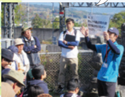
上越新幹線トンネル入口

地域について学んでメンバーと親しくなって他の人に伝えることで地域に還っていく、とてもよいサイクルができていますと事業であると思った。