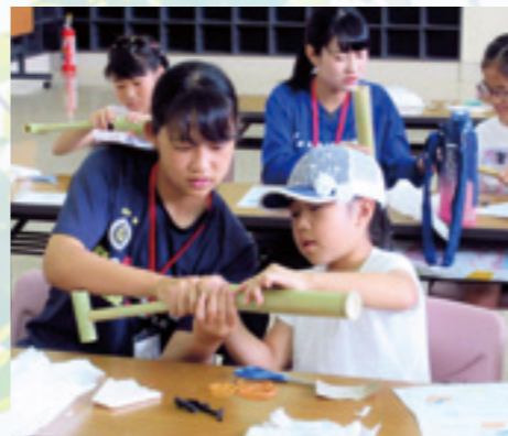
高崎女子高校生：主催事業の補助

各種学校等からの職場体験学習の生徒を積極的に受け入れています。活動内容は、主催事業の補助や館内の環境整備活動などですが、檜の箸作りや押し花の葉作りなどの利用者に提供しているプログラムも体験してもらっています。