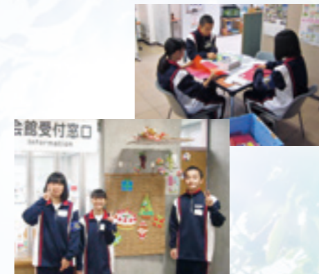
前橋商業高校生：館内の飾り作成