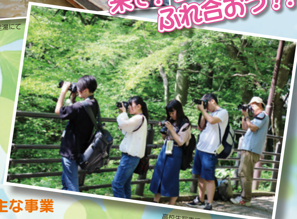
高校生写真講座：伊香保・河鹿橋にて