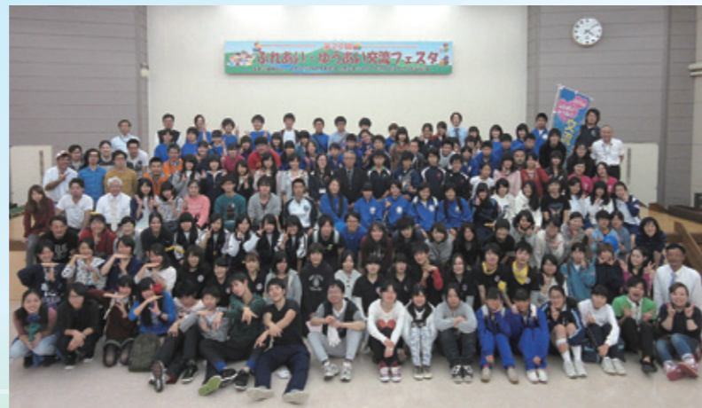
「心のバリアフリー」を目指し、障がい者との交流を図ります。中学生以上のボランティアスタッフがこんなに集まりました。(前日には、事前研修を行っています。)