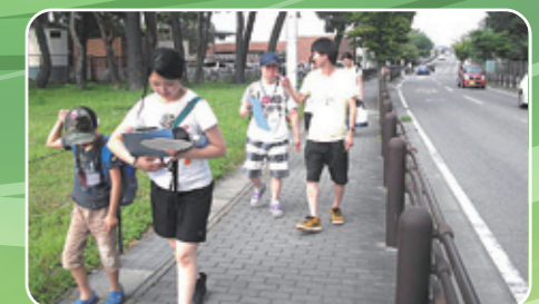
会館周辺でウォークラリー