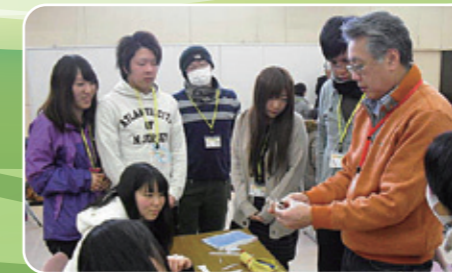
体験を通して指導力向上