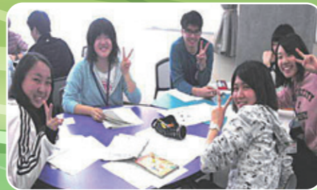
講習後は県内各地で体験