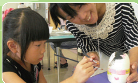
親子で楽しくこけしの絵付け