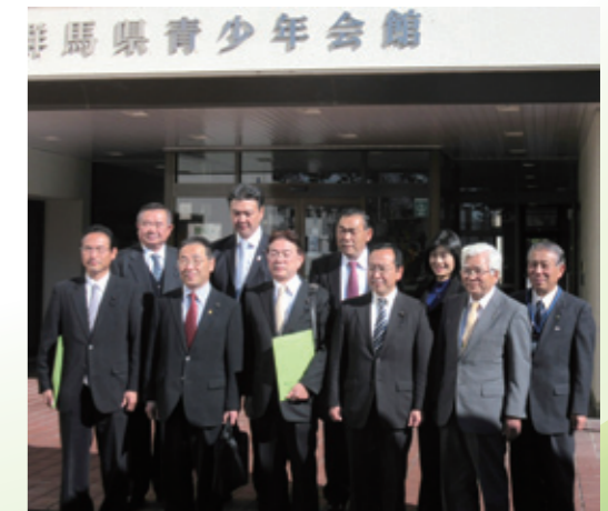
当事業団の会館運営や諸事業等を、視察していただきました。