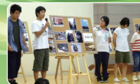
他校生とのグループで組写真作り