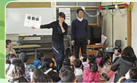
依頼を受けてボランティア活動