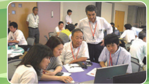
グループで相談しながらチラシ作り