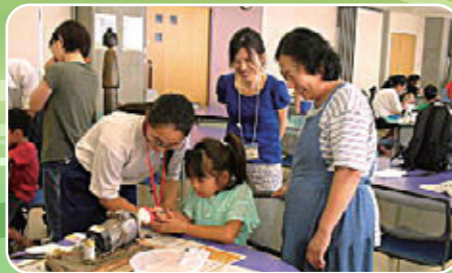
小学生にやさしく助言