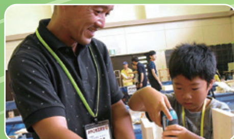
木工作はお父さんが大活躍!