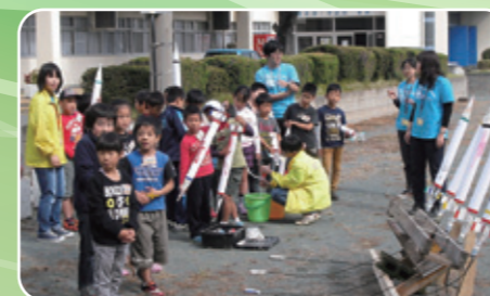
友の会が小学生向け4教室を実施