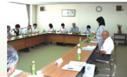
関係機関との連携会議