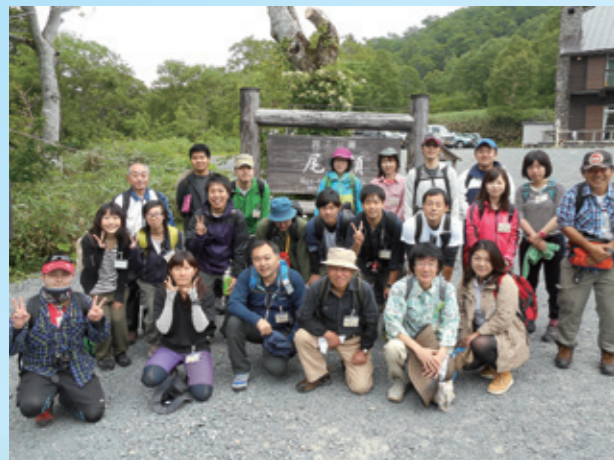
"群馬の誇り・尾瀬を歩こう"をテーマに、青年男女が参加しました。(後日、有志でバーベキューも。)