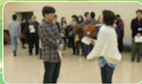
レクを通して相性判断!