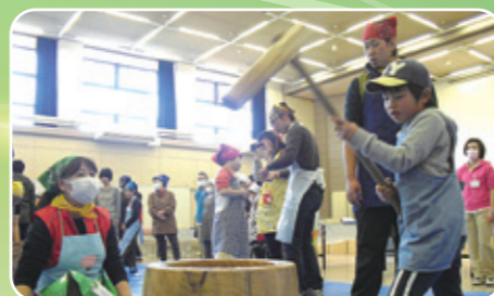
ボランティアスタッフの指導で