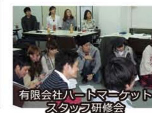
有限会社ハートマリケット スタッフ研修会