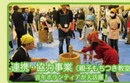
連携・協力事業(親子もちつき教室) 青年ボランティアが大活躍!