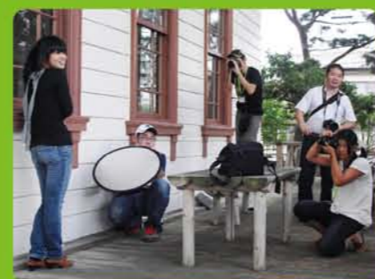
高校生のための写真講座 デジカメワークショップ 交流と技術の向上を!