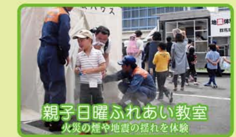
親子日曜ふれあい教室 火災の煙や地震の揺れを体験