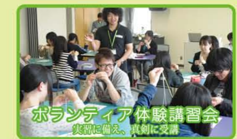
ボランティア体験講習会 実習に備え、真剣に受講