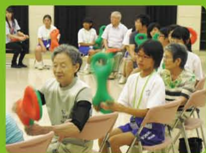
中学生交流ボランティア体験 中学生まごころボランティア体験 お年寄りと楽しく交流