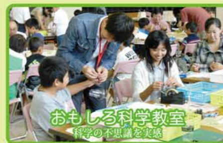
おもしろ科学教室 科学の不思議を実感