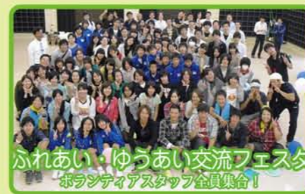
ふれあい・ゆうあい交流フェスタ ボランティアスタッフ全員集合!