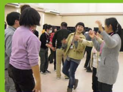
青少年指導者専門講座 わくわく指導者セミナー 指導技術のレベルアップ