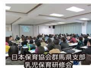
日本保育協会群馬県支部 乳児保育研修会