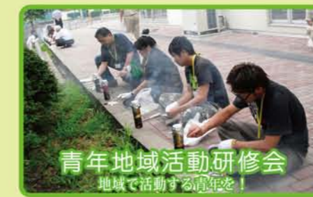
青年地域活動研修会 地域で活動する青年を!