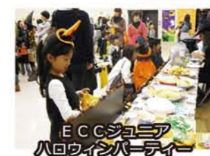
E.C.C.ジュニア ハロウィンパーティー